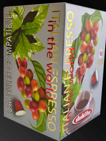
Dokito Silver Capsules Box 10 Capsules • Compatible NESPRESSO

Aromatic blend with fragrance of wildflowers, creamy with a honey aftertaste.