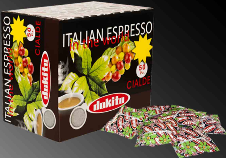
DOKITO Classic pods Mix Arabica and Robusta • 50 coffee pods

Precious blend of varieties of Arabica from high mountain regions for the most demanding palates, appreciated for its full-bodied taste and unbeatable aroma.