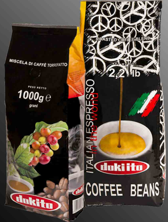
DOKITO Black Gourmet 100% Arabica Gourmet • coffee beans 1 Kg / 2,2 lb

An excellent coffee for the home espresso machine. Perfect balance and cream guaranteed by varieties of top quality coffee from high mountains.