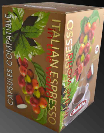
Dokito Gold Capsules Box 10 Capsules • Compatible NESPRESSO

Aromatic blend with fragrance of wildflowers, creamy with a honey aftertaste.