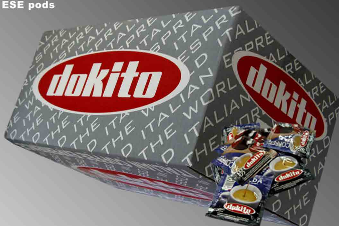
DOKITO exclusive pods 100% Arabica • 150 coffee pods

A blend of high quality Arabica varieties: intense aroma, velvet crema, delicate taste