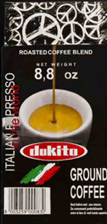
DOKITO Black Ground coffee 250 g / 8,8 oz

An excellent coffee for the home espresso machine. Perfect balance and cream guaranteed by varieties of top quality coffee from high mountains.