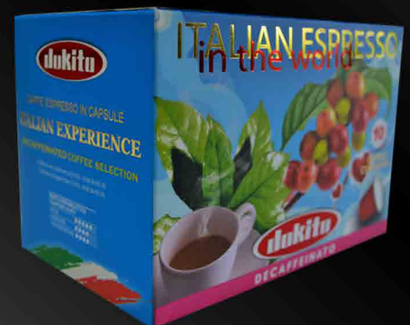
Dokito Decaffeinated Capsules Box 10 Capsules • Compatible NESPRESSO

A blend with long maturing, aromatic and with an average cream without caffeine.