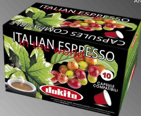
Dokito Classic Capsules Box 10 Capsules • Compatible NESPRESSO

Aromatic and full-bodied blend of Arabica and Robusta with decisive aroma.