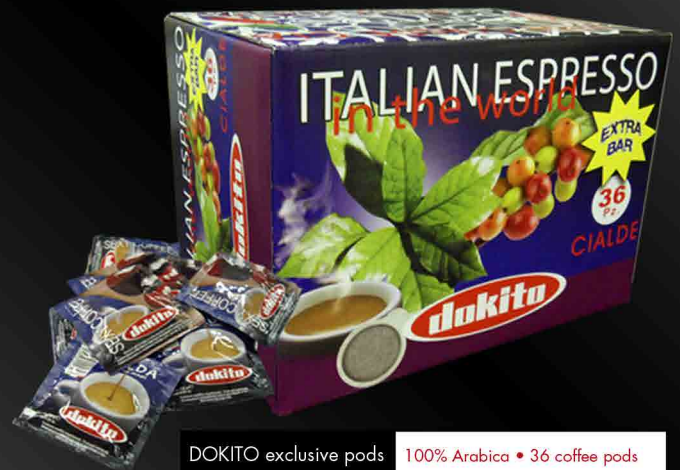
DOKITO exclusive pods 100% Arabica • 36 coffee pods

A blend of high quality Arabica varieties: intense aroma, velvet crema, delicate taste